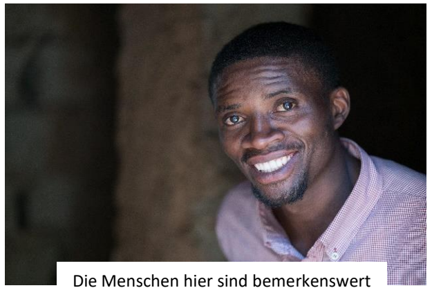
Die Menschen hier sind bemerkenswert freundlich und offen