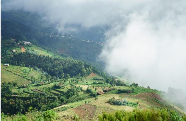
Ruanda ist ein wunderschönes und sehr grünes Land