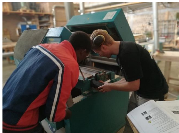
Technische Ausbildung in Rubengera